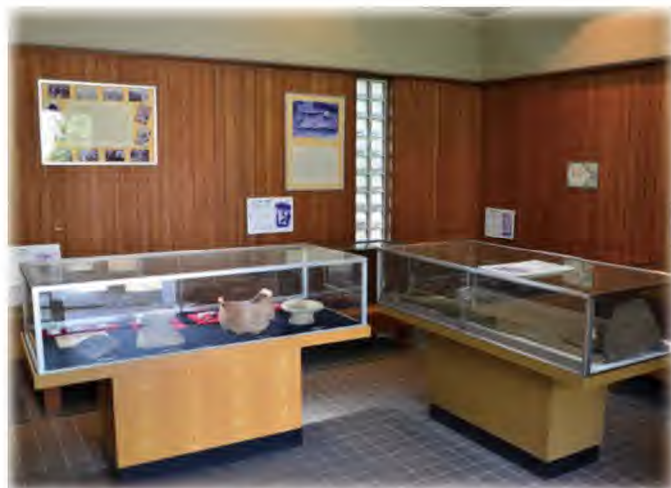
勝部遺跡収蔵庫内の展示