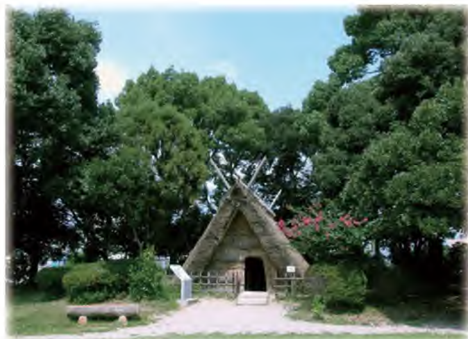
尼崎市立田能資料館史跡公園内の復元竪穴住居